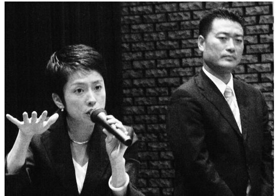
蓮舫 参議院議員をお招きしての会合にて国民の皆様が安心して生活を送って頂ける社会保障制度。年金・医療・子育て対策、後期高齢者医療制度についてお話を頂きました。